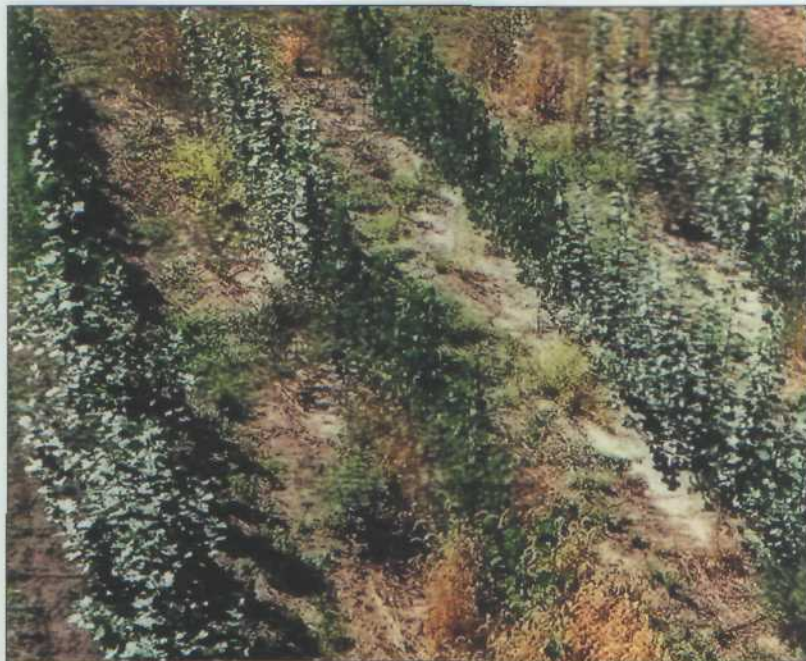
Рис. 4. Разные сорта тополя

тающей на местной биомассе вместо покупного жидкого топлива. Данный принцип весьма эффективен и на сегодняшний день уже широко применяется и в наших климатических условиях.