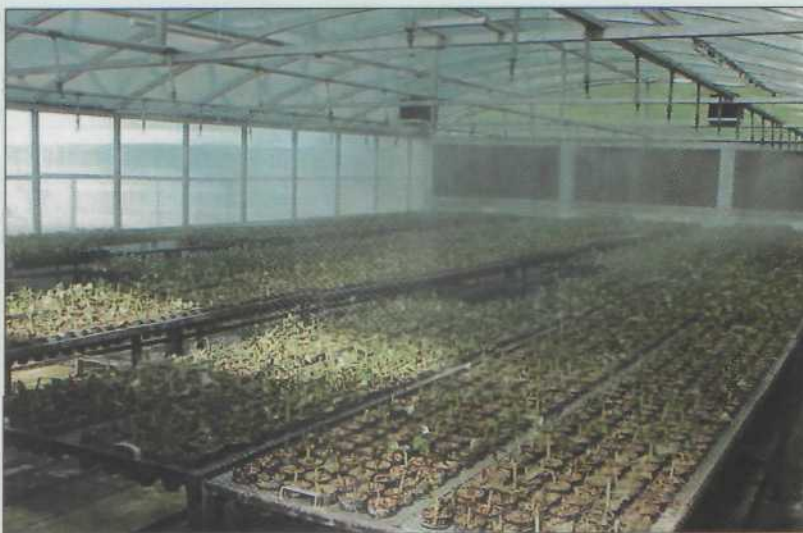
Рис. 3. «Маточные» плантации тополя