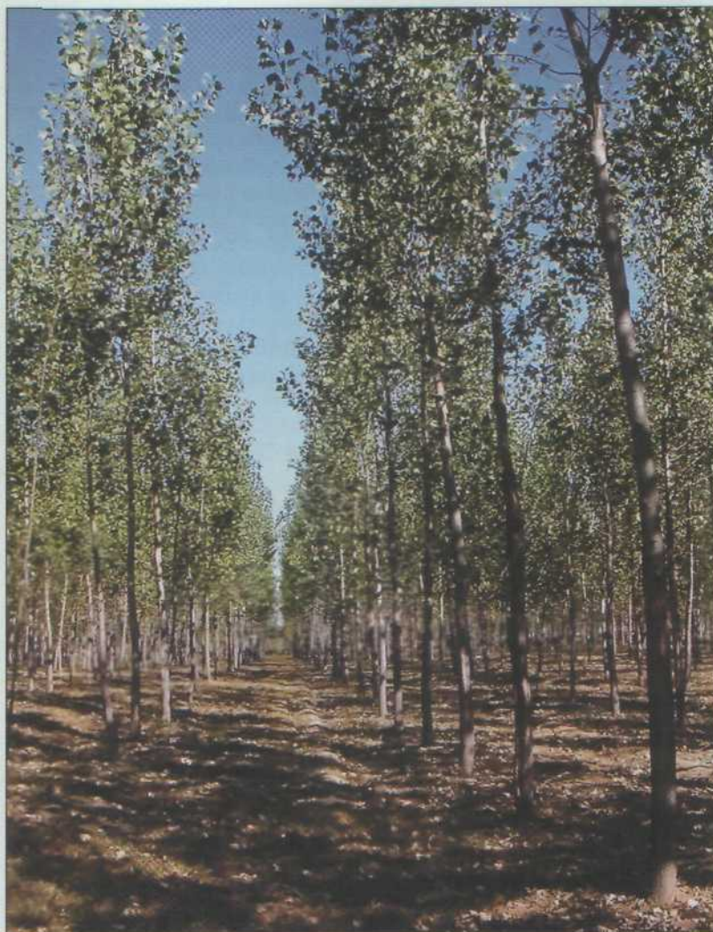
Рис. 5. Плантации тополя в Швеции

Выполнение всех этих мероприятий обеспечит быстрое воссоздание больших объемов товарной тополевой древесины.