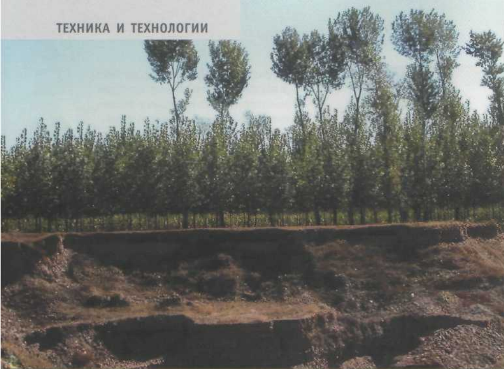
Рис. 6. Полезащитные полосы из тополя