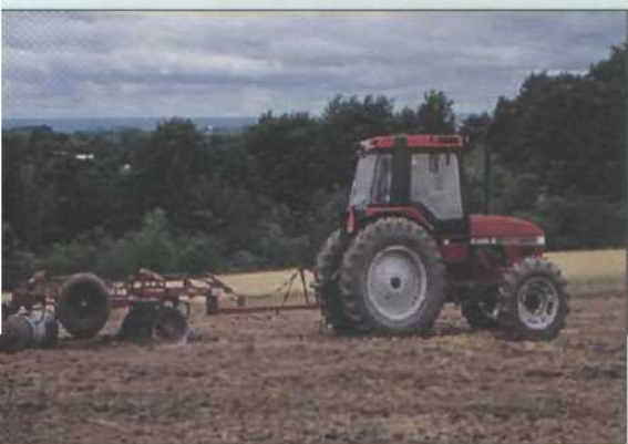
Рис. 2. Подготовка почвы для саженцев тополя

В странах Западной Европы большое распространение получил так называемый плантационный тип ведения хозяйства на тополь. При использовании данного метода выращивание тополевой древесины совмещается с одновременным использованием широких междурядий для выращивания сельскохозяйственных культур (пшеницы, риса, горчицы и т.д.). В северной части Индии при плантационном типе ведения хозяйства на тополь ежегодная прибыль с 0,405 га составляет от 326 до 652 долларов. Цена колеблется в указанном диапазоне в зависимости от качества полученной древесины, производительности плантации и продажной цены материала. Такой симбиоз сельской и лесной промышленности приносит пользу как лесовоспроизведению, воссозданию лесных ресурсов, так и фермерским хозяйствам, создавая новые рабочие места. При этом уменьшается стоимость сельхозпродукции за счет использования техники, рабо-